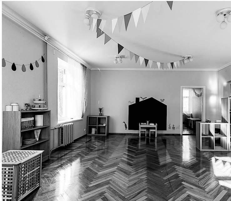
■ “BĒRNU CENTRS KĀ MĀJĀS”. Viens no sniegtajiem pakalpojumiem ir mazuļu pieskatīšana – gan sociāls ieguldījums, gan uzņēmuma finansiāls atspaidis.

Sociālais uzņēmums ir sabiedrība ar ierobežotu atbildību, kurai piešķirts sociālā uzņēmuma statuss un kura veic labvēlīgu sociālo ietekmi. Latvijā patlaban ir reģistrēti 74 sociālie uzņēmumi.